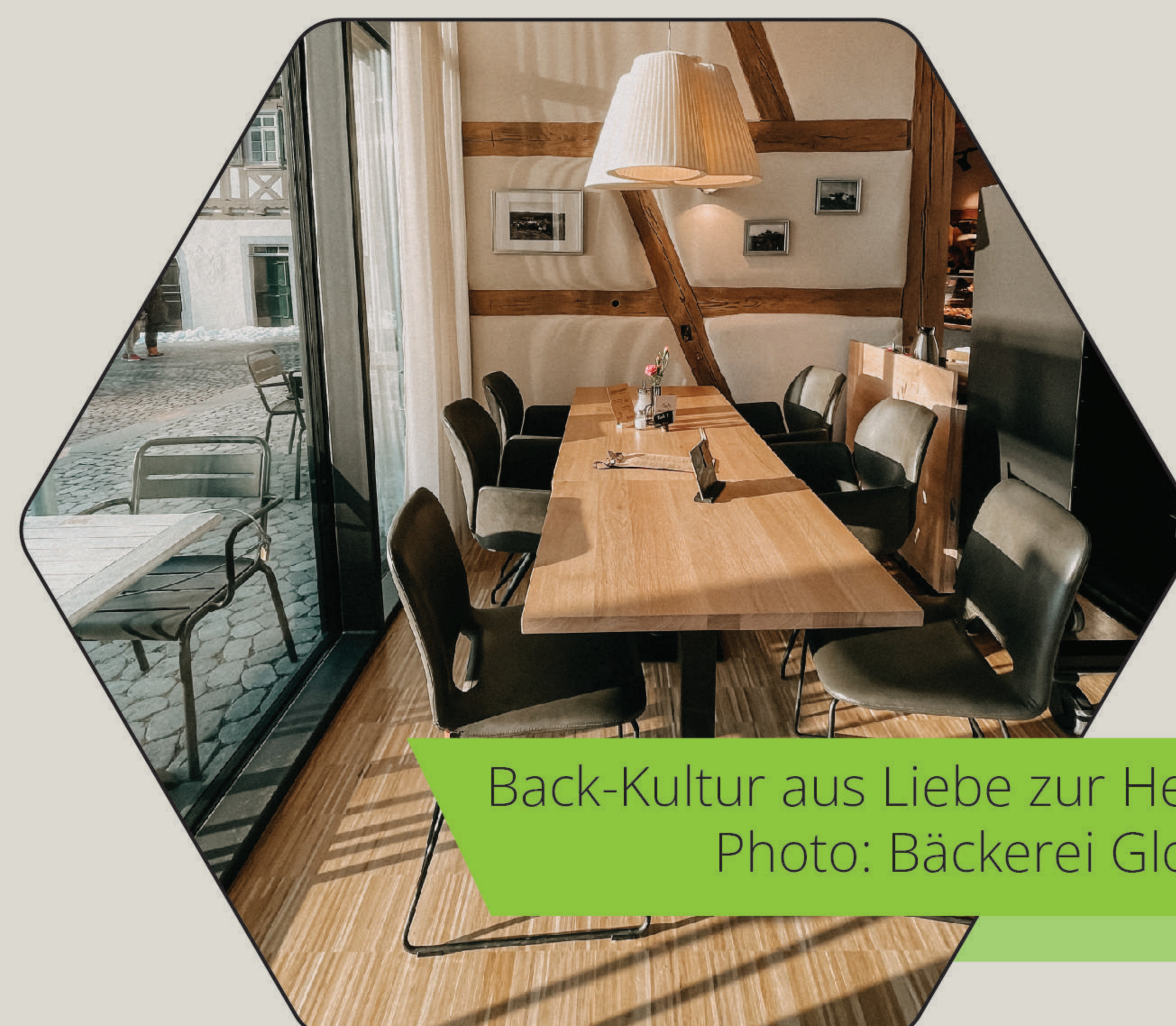
Back-Kultur aus Liebe zur Heimat

Möchten Sie mehr erfahren? Scannen Sie den QR-Code!