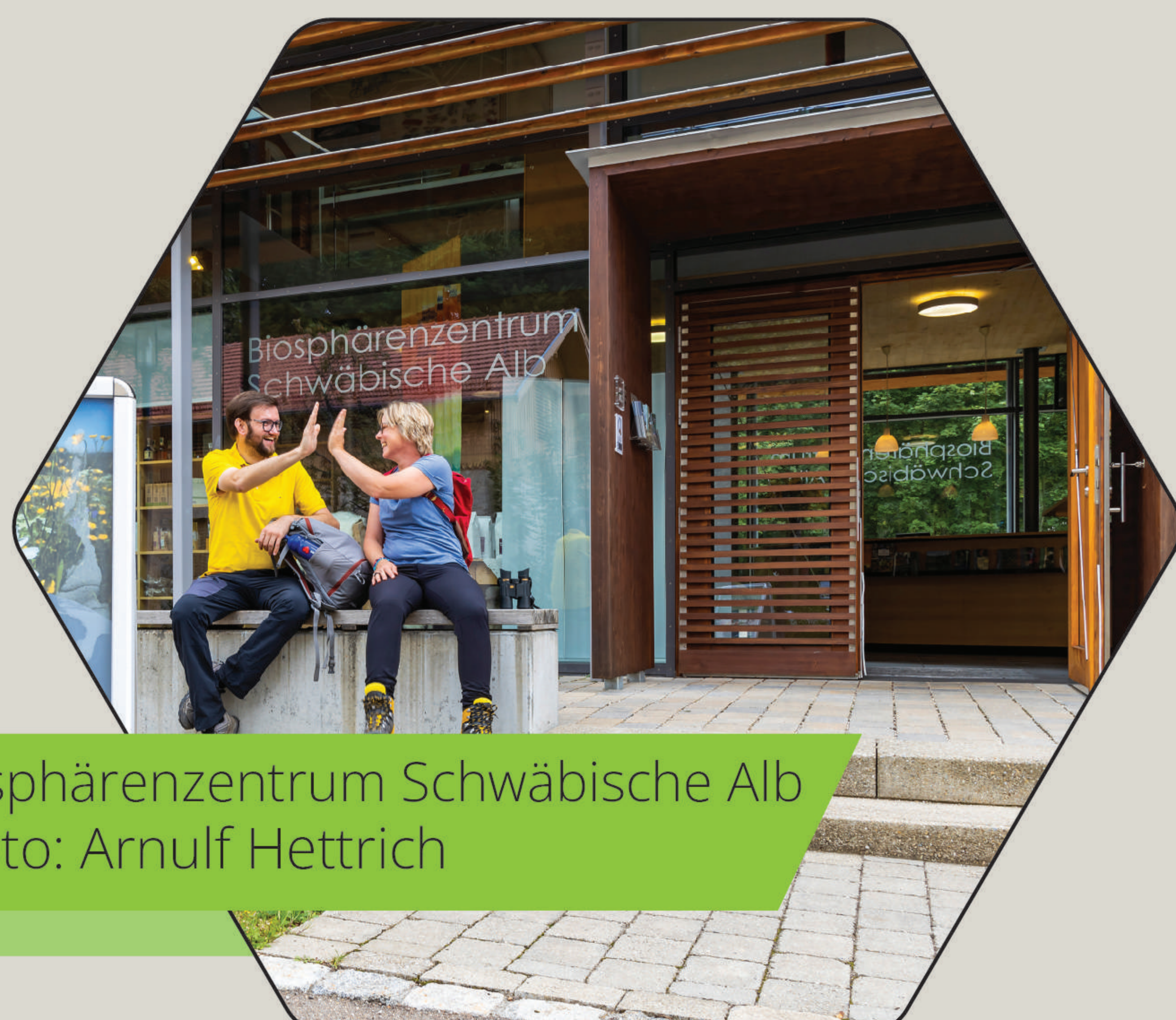
Biosphärenzentrum Schwäbische Alb

Praxisfälle, die sich mit Überalterung, Entvölkerung und damit verbundenen Umweltrisiken sowie mit nachhaltiger Regionalentwicklung befassen