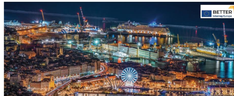
Immagine dall'homepage del servizio SegnalaCi

La digitalizzazione delle amministrazioni pubbliche e il miglioramento dei servizi al cittadino sono due temi che stanno beneficiando di una forte spinta all'innovazione, anche grazie a progetti finanziati dall'Unione Europea. "Better" è un progetto approvato nell'ambito del Programma Interreg Europe che si occupa, nello specifico, di ricerca, sviluppo tecnologico e innovazione nel campo della cosiddetta "e-governance", ovvero tutti quei processi digitali di amministrazione del territorio. Il Comune di Genova è capofila del partenariato, composto anche dai Comuni di Birmingham, Gaevle, Tartu e Nyíregyháza. Gli obiettivi del progetto "Better" sono legati allo stimolo dei cittadini alla partecipazione ai processi democratici attraverso Internet, al miglioramento dell'effici-