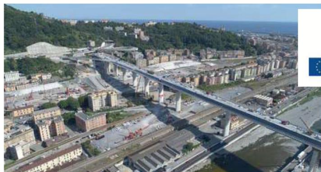
Il Nuovo Ponte di Genova, monitorato da un sistema innovativo

Il progetto BETTER tramite lo scambio e la diffusione di informazioni, le buone pratiche e le innovazioni tecniche attualmente disponibili e sperimentate dai partner dell'UE, punta a supportare iniziative di e-governance, migliorare le capacità manageriali e le conoscenze tecniche dei responsabili delle politiche locali, dei funzionari e degli esperti per delineare, gestire e valutare i servizi pubblici locali basati sulle nuove tecnologie. Il progetto nasce dalla collaborazione tra il Comune di Genova, leader partner, il Birmingham