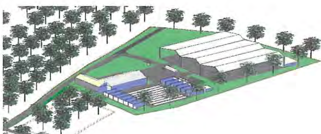
Fig. 1 Viitoarea platformă de compostare și depozitare temporară care va asigura gestionarea DCD după operaționalizarea Sistemului de Management Integrat al Deșeurilor în județul Maramureș.

Sursa de finanțare prevăzută este bugetul județean și local.