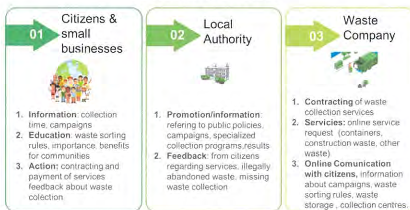
Fig. 3: Funcțiile aplicației

Acțiunea 2 are în vedere crearea unei aplicații care va fi personalizată pentru a fi utilizată de o comunitate definită și, în continuare, va fi foarte ușor de: