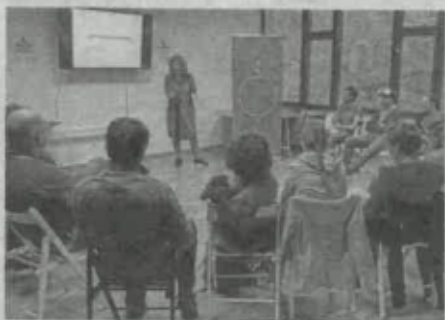
Točka SPOT svetovanje Gorenjska v Kovačnici

podjetja, zapreti podjetje ... Podjetnike obveščamo o aktualnih finančnih spodbudah, kot so trenutno najbolj aktualni vavčerji, na podlagi katerih lahko podjetja iz posameznega odobrenega vavčerja pridobijo sofinancir-