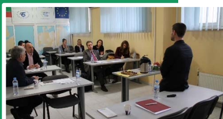
Reunión en Stara Zagora, Bulgaria