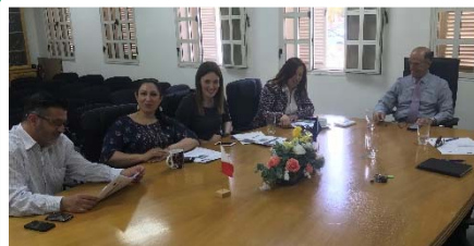
Reunión en Malta