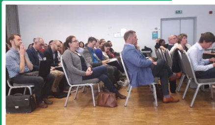
Reunión en Amberes, Bélgica