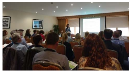
Reunión en Dublín, Irlanda

La implementación de la CPV también debe ser monitoreada. La medición, comparación y celebración de casos de éxito en la implementación de la CPV en organizaciones públicas puede actuar como un factor motivador que alentaría a otras a aplicar prácticas de CPV en sus procesos de adquisición.