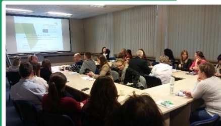
Reunión en Lodz, Región de Lodzkie, Polonia

Una mayor conciencia sobre CCV también traerá otros conceptos relacionados con CPV a compradores y proveedores a la vanguardia. (continúa al dorso ...)