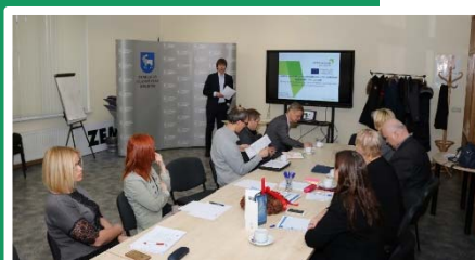
Reunión en Jelgava, región de Zemgale, Letonia