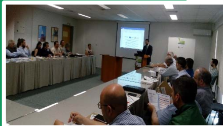
Reunión en la Universidad de Patras, Grecia

La cuestión del apoyo de alto nivel para la CPV dentro de los organismos públicos se planteó en varias reuniones. La falta de motivación política en torno a la CPV se percibe como un obstáculo real. El apoyo a la CPV por parte de los políticos y la gestión de alto nivel dentro de los organismos públicos es fundamental, ya que son estos interesados los que abogan por ciertas recomendaciones de políticas, aprueban la financiación de proyectos, etc. El apoyo político, financiero, de desarrollo de capacidades e incluso legal (con respecto a cualquier aclaración necesaria de la ley de Contratación) es fundamental para que la CPV se convierta en el enfoque estándar dentro de los organismos públicos.