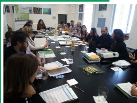
Reunión en Sevilla, Andalucía, España