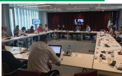
Reunión en Milán, Región de Lombardia, Italia