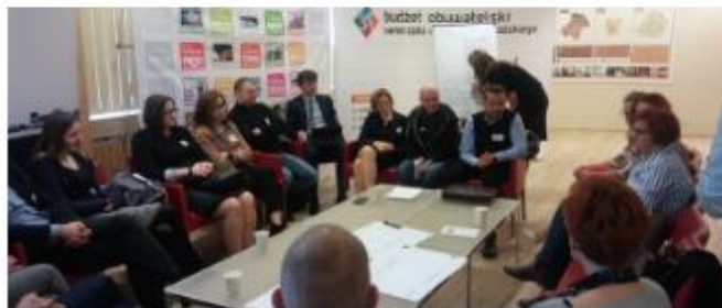
Περιφέρεια της Λότζκι - 5 η Περιφερειακή Συνάντηση