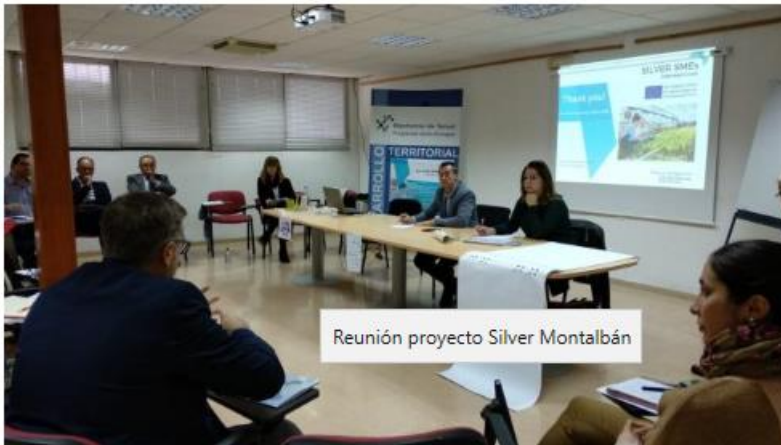
Reunión proyecto Silver Montalbán

La Diputación Provincial de Teruel (DPT) ha organizado una jornada en el municipio de Montalbán con la que busca promover los negocios relacionados con los mayores, en el marco del proyecto europeo Silver SMEs Interreg Europe. El objetivo es impulsar, antes del final de 2021, un total de 15 nuevos comercios o ampliaciones ya existentes para producir bienes o prestar servicios a personas jubiladas.