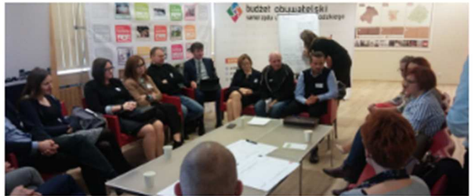
Regio Lodzkie - 5 e bijeenkomst voor stakeholders