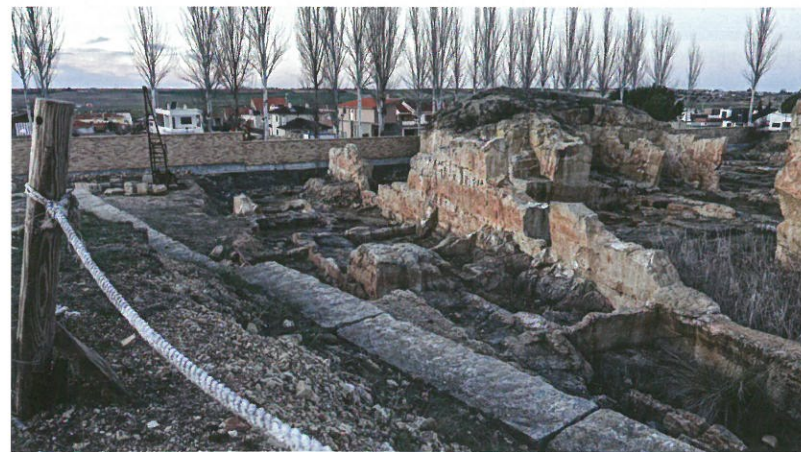
Obr. 3 Vytěžený pískovcový lom Piedra Natural v blízkosti obytné zástavby města Salamanca, který je zpřístupněný veřejnosti k volným prohlídkám - jedna z možností efektivního využití území a podpory Public Relations.

Podrobnější informace o probíhajícím evropském projektu lze nalézt na www.inter-regiurope.eu/remix/ nebo u autora příspěvku.