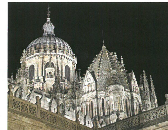
Obr. 4 Stavby v historickém centru města Salamanca - postavené z pískovce vytěženého v nedalekém lomu Piedra Natural.