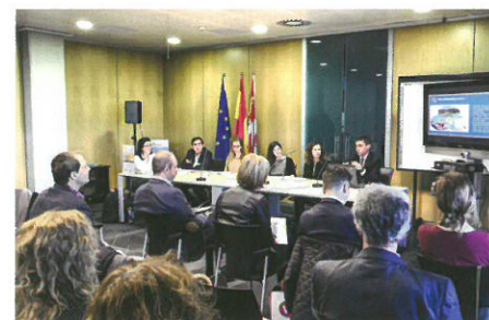
Obr. 1 Průběh jednání, kde byly prezentovány zkušenosti z dobývání ložisek nerostných surovin ve španělské provincii Kastilii León.

Na případech lomových provozů byly konzultovány osvědčené postupy bezpečného a efektivního dobývání a úpravy vytěžených surovin, vč. následného využití území po ukončení těžby.