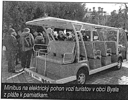
Minibus na elektrický pohon vozí turistov v obci Byala z pláže k pamiatkam.

Tento systém by mal slúžiť obyvateľom aj návštevníkom Slovenského raja, ktorí často narádzajú na rôzne ťažkosti s dopravou na poslednom úseku ich cesty (či už pri príchode do destinácie alebo pri pohybe po nej) – odtiaľ „posledná míľa“. Aktivity projektu nadväzujú napr. aj na služby ski busu a letného busu a snahu OOCR Slovenský raj & Spiš o zlepšenie dostupnosti stredísk cestovného ruchu. Cieľom je alternatívnymi flexibilnými formami dopravy zlepšiť prístupnosť odľahlejších turis-