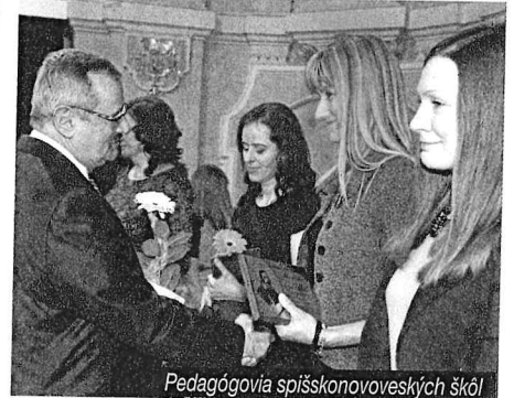
Pedagógovia spišskonovoveských škôl