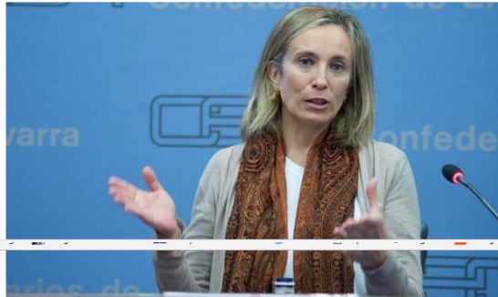
Izaskun Goñi, directora general de Política Económica. (IÑAKI PORTO)

PAMPLONA. La directora general de Política Económica y Empresarial y Trabajo del Gobierno de Navarra, Izaskun Goñi, ha apostado este miércoles durante la clausura de la jornada de lanzamiento del proyecto europeo 'Inside out Europe' por apoyar la internacionalización de las pequeñas y medianas empresas (pymes) de Navarra con el fin de fortalecer su competitividad a largo plazo.