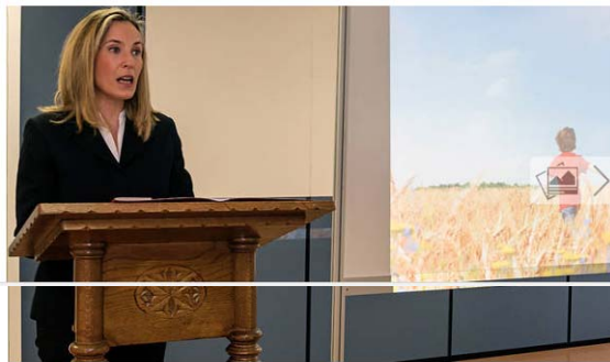
La directora general de Política Económica y Empresarial y Trabajo, Izaskun Goñi, en un acto Montxo A.G. anterior.

Navarra lidera un proyecto europeo con un presupuesto total de 1,47 millones y en el que participan otros siete socios de Holanda, Hungría, Italia, Noruega, Reino Unido y Suecia