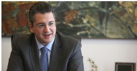
Τζιτζικώστας: «Όσο είμαι περιφερειάρχης δεν θα υπάρξει κυβέρνηση που θα αγνοήσει την Αμφίπολη»