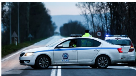
Αυτοί βίαζαν τα δύο αγοράκια στη Θεσσαλονίκη