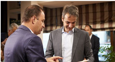
Μητσοτάκης: Η ανάπτυξη δεν έρχεται με ψεύτικες υποσχέσεις