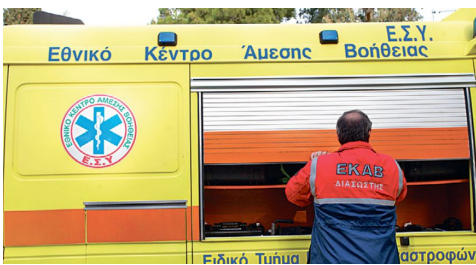
Τραγωδία – Νεκρά εντοπίστηκαν δύο ανήλικοι στην Κομοτηνή