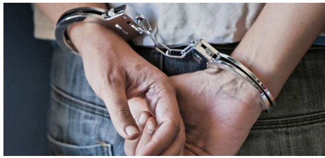
Σύλληψη 60χρονου Γερμανού, με Ισπανική εντολή στην Ελλάδα