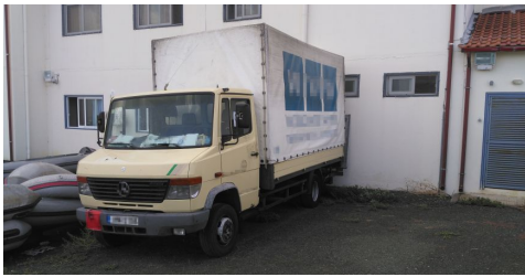
18χρονος Πακιστανός μετέφερε 15 μη νόμιμους μετανάστες