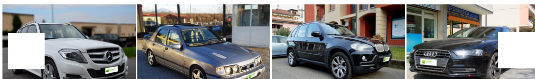
MERCEDES Classe GLK - € 31500