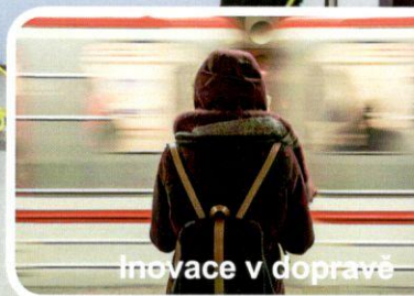
Inovace v dopravě