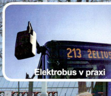
Elektrobus v praxi