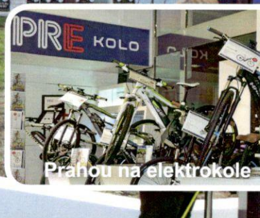
Prahou na elektrokole