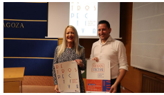
Los carteles y otros ejemplos publicitarios de Retrospectiva.

El Periódico de Aragón | 02/05/2023 | 14:17