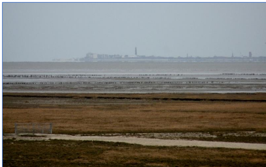
Waddenské moře, lokalita UNESCO