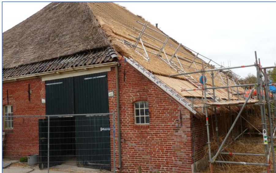
Renovace farmy v Maarhuizenu

Projekt MOMAr je realizován v rámci programu INTERREG EUROPE a je spolufinancován z prostředků Evropské unie (ERDF) a Jihočeského kraje