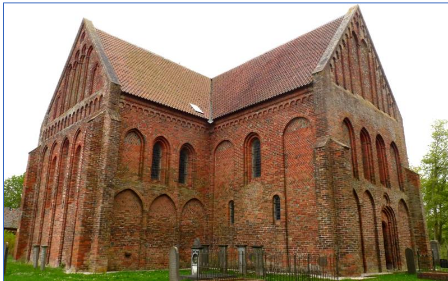
Kostel v Garmerwolde

Projekt MOMAr je realizován v rámci programu INTERREG EUROPE a je spolufinancován z prostředků Evropské unie (ERDF) a Jihočeského kraje