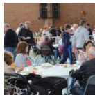
La celebració de Sant Jordi a Mequinenza es trasllada del Poble Vell al Poble Nou pel temps