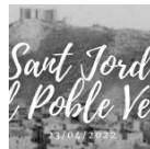
Mequinenza tornarà a celebrar Sant Jordi als carrers del Poble Vell quan es compleix el 50 aniversari...