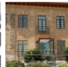
Els Museus de Mequinenza actualitzen el seu horari a primavera-estiu a partir de l'1 d'abril