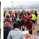
Prop de 400 persones van participar a la XIV Marxa Senderista i Solidària de Mequinenza