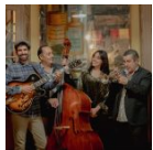
Tot llest a Mequinenza per a un intens maig cultural