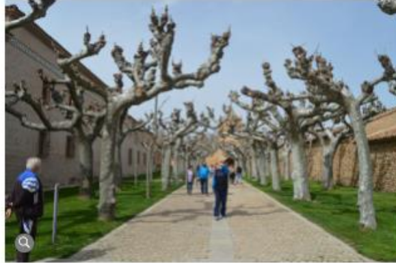
Entrada al Monasterio de Veruela / SER Tarazona

En los últimos años, el turismo se ha colado en la agenda política de los pueblos como una herramienta cargada de posibilidades para combatir la despoblación . En un mercado turístico global, cada municipio o comarca trata de buscar y potenciar su singularidad, como el 'turismo de brujería', que tanto impacto tiene en esta zona de Aragón. Con la ayuda de alcaldes y de la Comarca de Tarazona y analizaremos cómo los pequeños y medianos Ayuntamientos articulan su oferta turística.