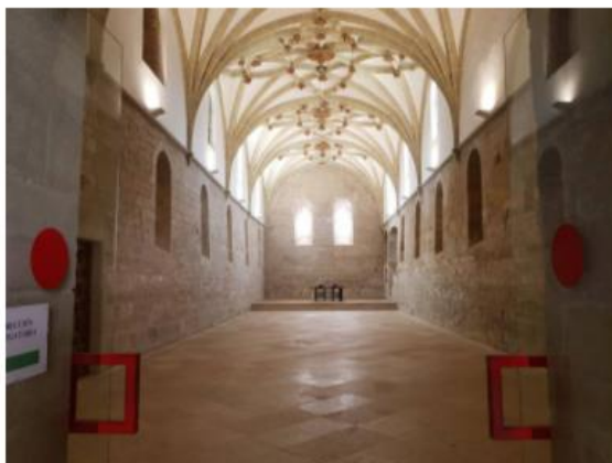
Refectorio del Monasterio de Veruela / SER Tarazona

El próximo 30 de abril, la Cadena SER abre el debate sobre las posibilidades del turismo rural en la lucha contra la despoblación en la abadía cisterciense de la comarca de Tarazona y el Moncayo.