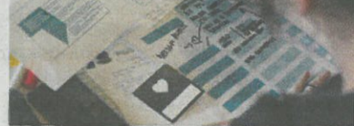
Projekt Design 4 Innovation, źródło: Urząd Marszałkowski Województwa Śląskiego

W rozstrzygniętych dwóch dotychczas naborach zatwierdzono 130 projektów i tym samym rozdysponowano 175 mln euro z EFRR. W ww. projektach uczestniczy 53 partnerów z Polski, w tym 3 z województwa śląskiego, są to: Górną Śląską Agencją Przedsiębiorczości i Rozwoju sp. z o.o. w Gliwicach, która realizuje projekt COMPETE IN (dotyczący internacjonalizacji sektora małych i średnich przedsiębiorstw), Główny Instytut Górnictwa realizujący projekt MOLOC (nt. przechodzenia na gospodarkę niskoemisyjną) oraz Województwo Śląskie, które wdraża projekt Design 4 Innovation (poświęcony promowaniu designu i zasad dobrego projektowania jako narzędzi dla innowacji wzmocniających konkurencyjność MŚP).