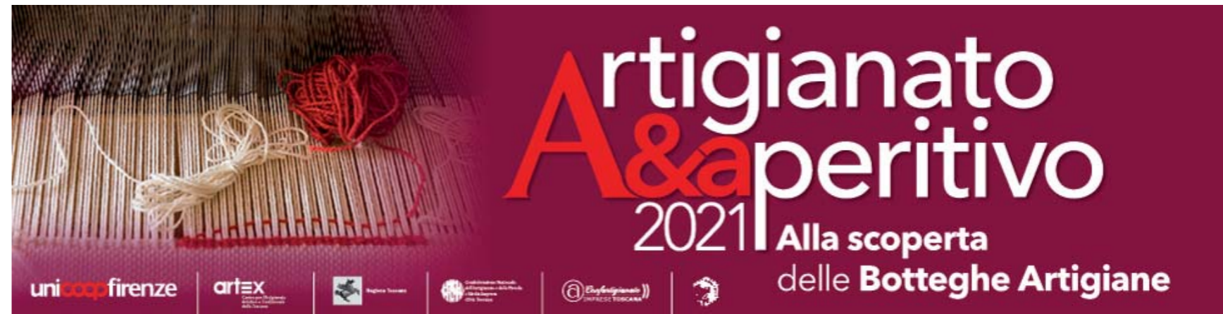
Alcune delle uscite quotidiane sui social media