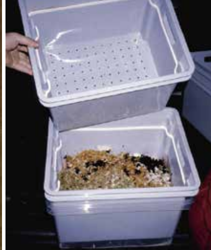
De 2 meest gebruikte wormenbaktypes (monobak en stapelbak) en de gaatjes in de geperforeerde bak