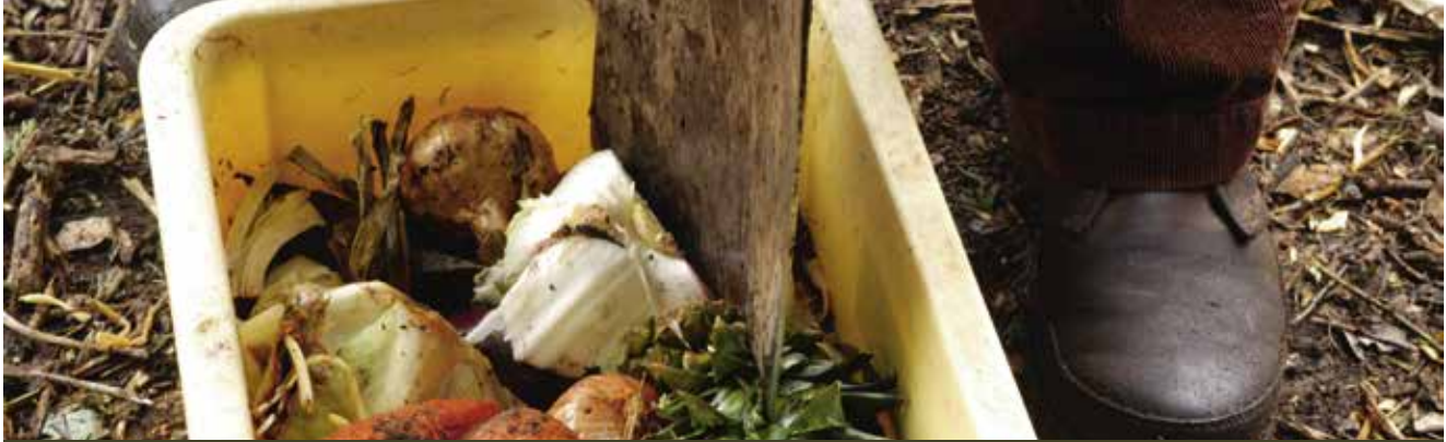
Verklein wat te grof of te lang is