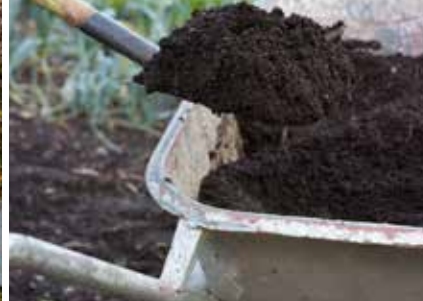
Compostbakken met een uitneembare voorzijde vergemakkelijken het omzetten