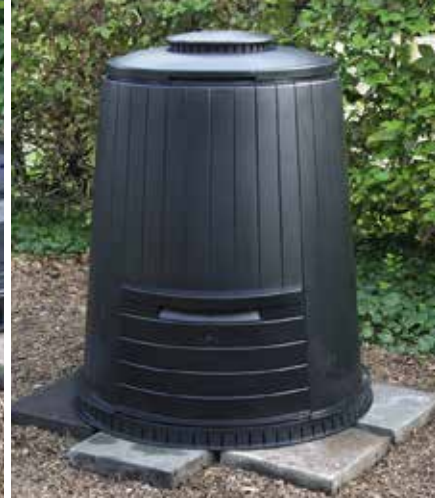
Het plaatsen van het compostvat:: eerst de tegels, dan de bodemplaat, vervolgens de romp.

timeters van de bodem verwijderd blijft. U hoeft niet te vrezen dat de afbraakorganismen niet in het vat kunnen komen. Ze klimmen zonder problemen langs de stenen naar boven, door de gaatjes van de bodemplaat. Wanneer u het vat niet ondersteunt met stenen, dan zult u na een paar maanden vaststellen dat het vat in de bodem zakt of scheefzakt (en soms zelfs breekt) en dat de beluchtingsgaten verstopen. Het composteringsproces is dan gedoemd te mislukken wegens gebrek aan lucht. Door de bodemgaten kan overigens het overtollige vocht ook wegsijpelen, terwijl de nuttige bodemorganismen toch in het vat kunnen komen.